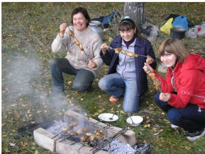
Фото с туристического похода в 2009 г.