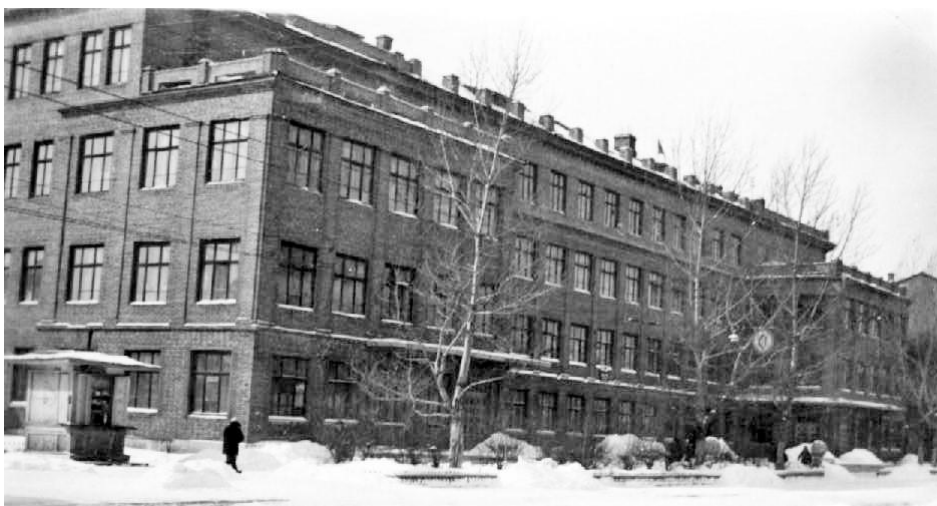
Куйбышевский государственный педагогический институт им. В.В. Куйбышева.

По словам самой бабушки, профессия учителя вечная. Стране всегда нужны молодые образованные люди, так как с каждым годом появляются новые образовательные технологии, которые нужно осваивать и применять на практике. Проработав в школе 43 года, бабушка не жалеет о том, что посвятила жизнь школе и детям.