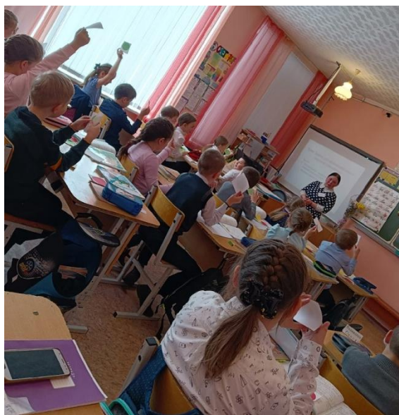
Урок математики во 2 «В» классе