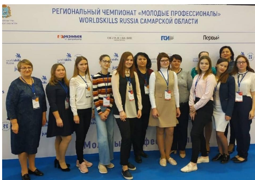
World Skills Russia 2019 г.

На первом курсе я пробовала свои силы и в юниорской компетенции Ворлдскиллс Россия. Этот конкурс основан на том, чтобы молодые специалисты показали свои умения и навыки преподавания, демонстрируя фрагмент урока, элементы, освоенные на практики. И это всё даёт бесценный опыт для дальнейших успехов в работе учителя.