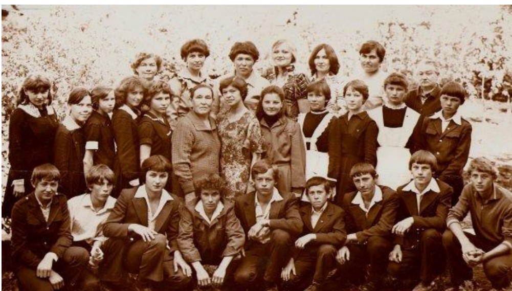
Фото выпускников 1989 года

По словам самой бабушки, профессия учителя вечная. Стране всегда нужны молодые образованные люди, так как с каждым годом появляются новые образовательные технологии, которые нужно осваивать и применять на практике. Проработав в школе 43 года, бабушка не жалеет о том, что посвятила жизнь школе и детям.